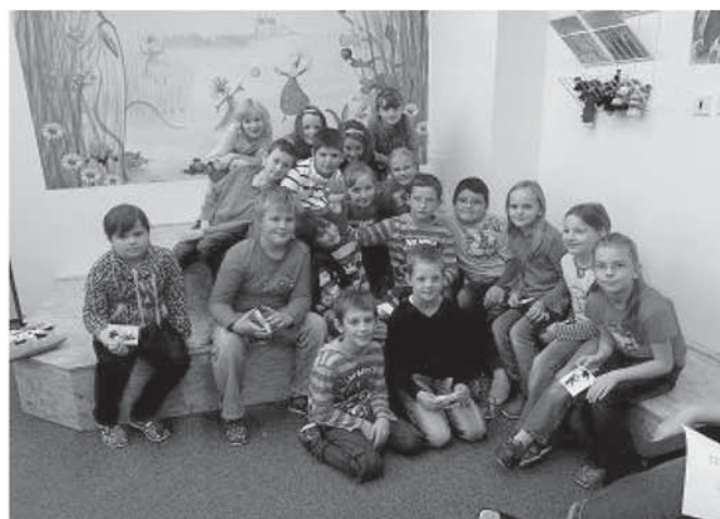
Žáci 3. tříd při návštěvě knihovny 8. 11. 2010