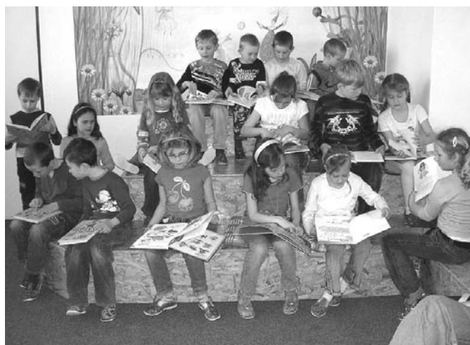
„Poprvé v knihovně“ – 1.4.2008 žáci 1.A a 1.B navštívili knihovnu a někteří z nich už jsou dnes i registrovanými čtenáři knihovny...